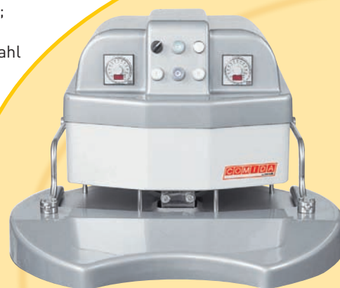
Dettaglio pannello comandi GALASSIA PN Detail of control board of GALASSIA PN Detail der Schalttafel vom GALASSIA PN Detail du panneau de contrôle du GALASSIA PN Detalle del cuadro de mandos GALASSIA PN