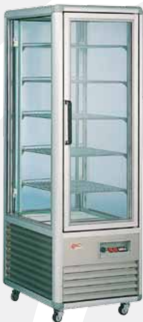
GL350K cioccolato chocolate