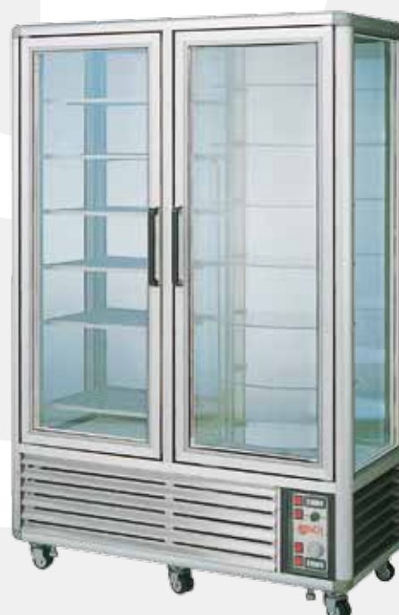
GL750GP gelateria + pasticceria gelato + cakes and pastry