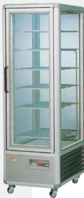
GL400G gelateria gelato