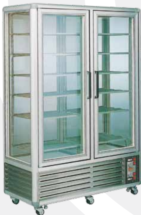
GL750GG gelateria gelato

® 02-201 Warszawa, ul. Opaczewska 85 tel. (+48 22) 846 15 74, (+48 22) 846 39 96 fax (+48 22) 846 25 34 e - mail: info@k-2.com.pl www.k-2.com.pl