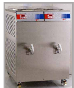
Podwójny Pastmatic - Pastotronic