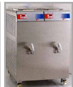
Podwójny Pastmatic - Pastotronic