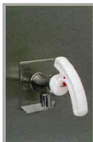
Zawór spustowy w pozycji zamkniętej.